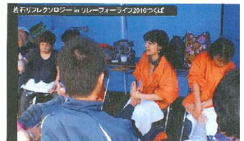
▲ 5月23日(日)つくば中央公園にて

ているんだよ。私つらいの我慢して頑張っているんだよ。だから毎日イイ子イイ子してね」という足からのメッセージ。そんなお話をお客様とすると「触ってあげるだけでもいいんですか？じゃあ出来るかな。やってみよ」何だか伝わった気がして嬉しかったです。自分の身体をいたわる気持ち大切にしたいです。