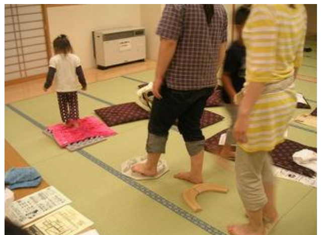
▲色々な形の踏板で健康遊歩道を体験！

「☆の反射区だよ！よくもんであげてね」と指導...質問タイムはいつもにぎやかです！