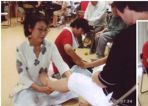
足もみ棒を使ったセルフケアの指導

この度、ヨガスタジオ及び足療サロンも出来た事を機に「初級プロ講座」を開講していきます。前回、初級プロになられた方々は、それぞれの場所で地域の方の健康アドバイザーとして活躍しております。そんな中から、また、講座希望者が出てきたりしています。これからの目標は、健康アドバイザーが多くなって、足もみボランティアとして市のイベントにブースを出せる様、がんばって行きます。そして、健康で明るい笑顔あふれる社会が実現できる事です。