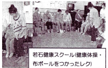
若石健康スクール(健康体操・布ボールをつかったレク)