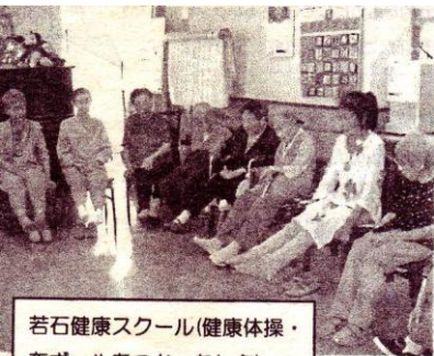
若石健康スクール(健康体操・布ボールをつかったレク)