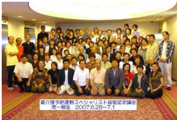
要介護予防運動スペシャリスト資格認定講座 第一期生 2007.6.28~7.1